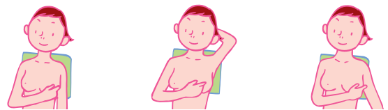
左の乳房の外側半分を調べるには、右手の指の腹でまんべんなく触れてみます。わきの下に手を入れて、しこりの有無も確認