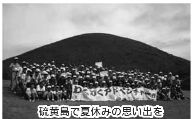
硫黄島で夏休みの思い出を

◇内容 三島村硫黄島でキャンプなどの自然体験 ◇対象 市内に住む小学4年～高校生 ◇期日 7月21日(火)～24日(金) ◇定員 100人(超えたら抽選) ◇参加料 1万2000円程度 ◇申し込み 電話かほかき、ファックスで住所、参加者氏名、保護者氏名(ふりがな)、性別、学校名、学年、電話番号を6月14日(必着)までに 〒892-0871吉野町11078-4市立少年自然の家 244-0333(FAX244-0334)へ