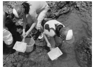
磯の生きものを観察しよう

◇参加料 無料 ◇申し込み 往復はがきに催し物名、住所、氏名(ふりがな)、年齢、性別、電話番号、学校名、学年を書いてかごしま水族館へ