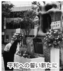
平和への誓い新たに

■太平洋戦争民間犠牲者慰霊碑 「人間之碑」への献花 ◇日時... 6月17日(水)9時~ ◇場所... 太平洋戦争民間犠牲者慰霊碑前(みなと大通り公園内海側) 〈地域福祉課 216-1244〉