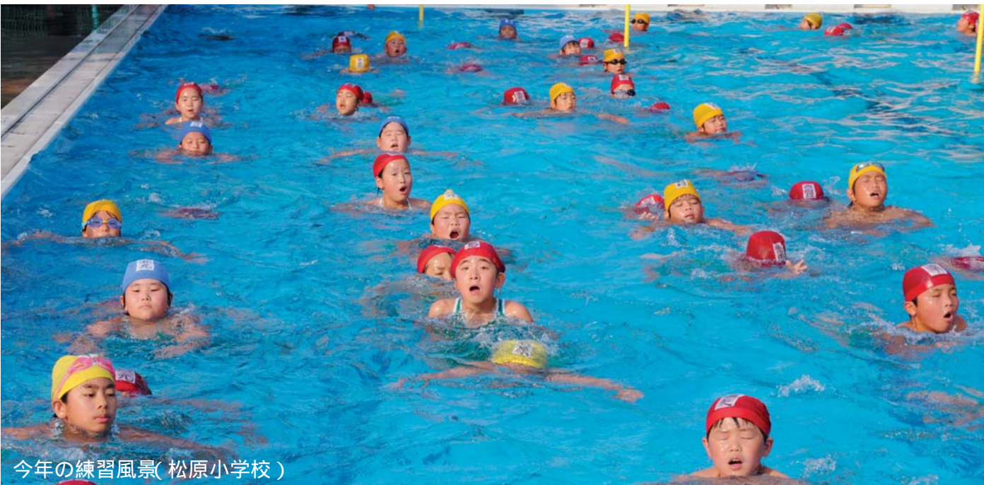
今年の練習風景(松原小学校)