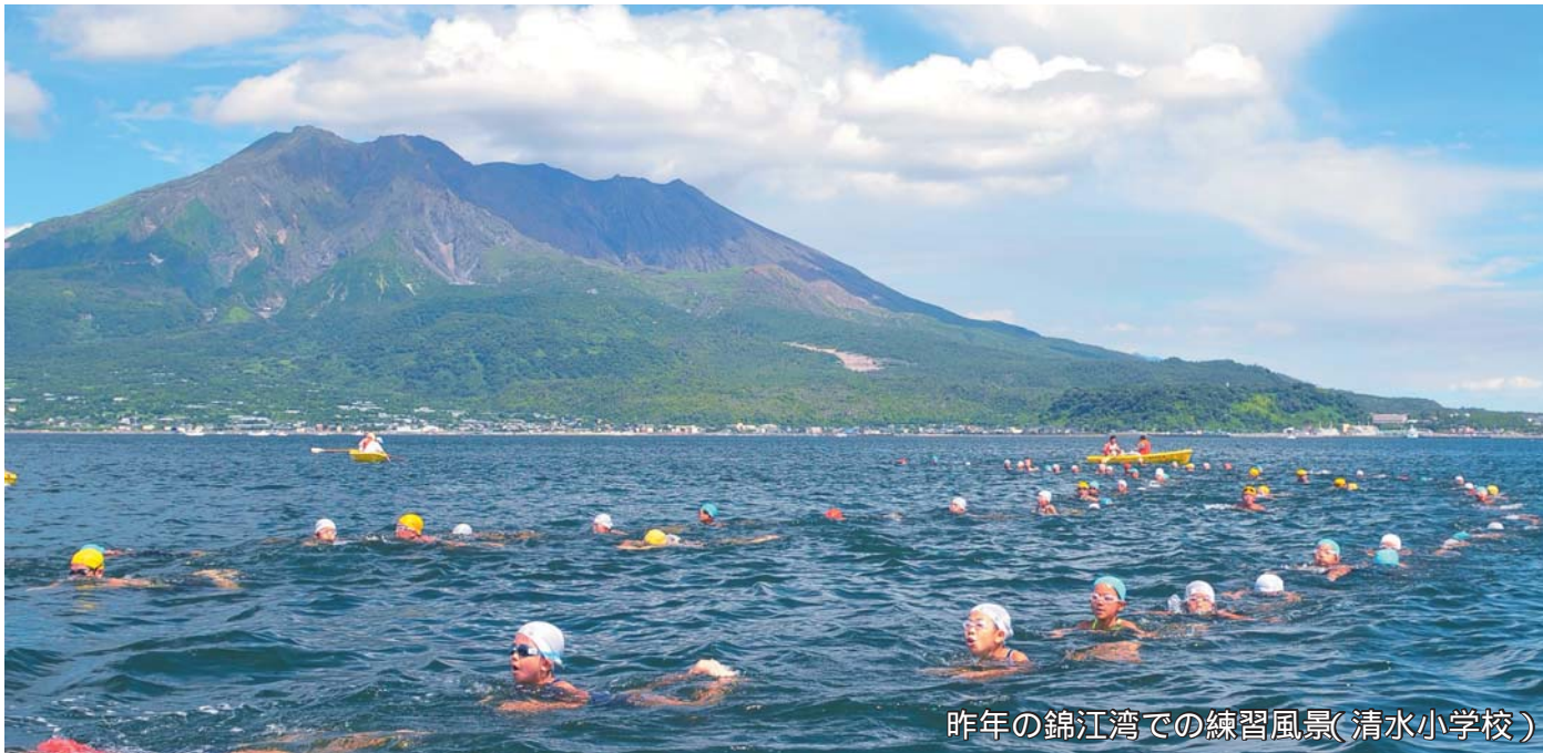
昨年の錦江湾での練習風景(清水小学校)