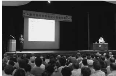
いざというときの備えは十分ですか

■市高齢者安心安全の集い ◇内容...交通安全に関するビデオ上映、防災・気象に関する講話など ◇日時...8月29日(土)10時～12時 ◇場所...中央公民館 ◇入場は無料 ◇お楽しみ抽選会や参加記念品もあります ◇詳しくは安心安全課216-1209へ