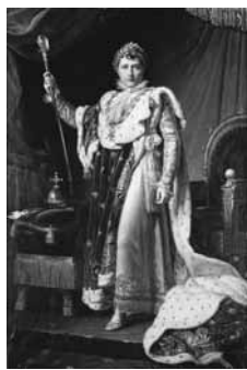
ジェラルド「戴冠式のナポレオン1世」