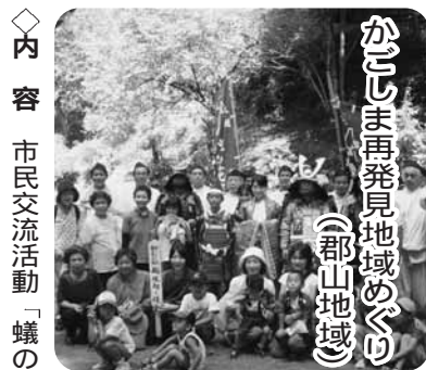
かごしま再発見地域のめぐり(郡山地域)