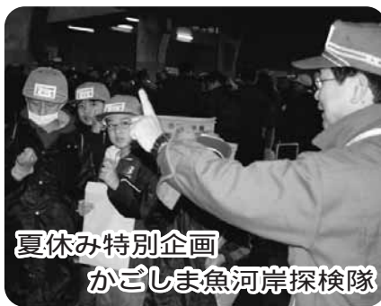
夏休み特別企画 かごしま魚河岸探検隊