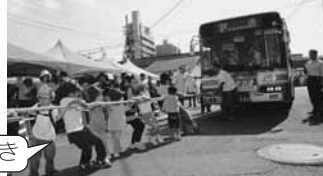
力を合わせてバスと綱引き

◇内容 行先表示器でメッセージ、手形ペインティングバス、バスと綱引き、トロッコ自転車、電車・バス記念撮影会、電車模型走行展示会、路面電車パネル展示、家庭用品バザー、演奏会(リコーダー奏者・吉嶺史晴氏、サザンウインド)、各種出店など ◇日時 11月29日(日)10時～15時30分 ◇場所 交通局(高麗町43-41) ※駐車場はありません。会場へは市電・市バスをご利用ください