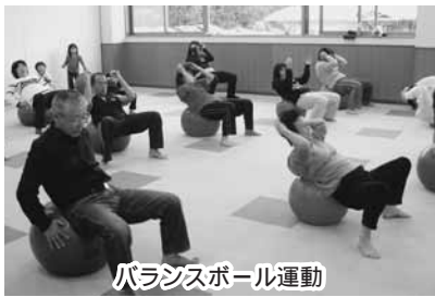
バランスボール運動