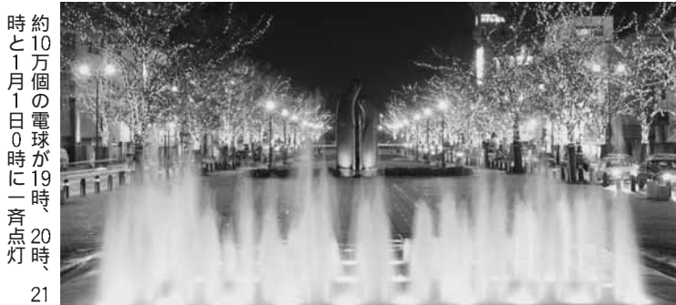
約10万個の電球が19時、20時、21時と1月1日0時に一斉点灯

◆ イ・農産加工品などの販売、茶の試飲・詰め放題 ◆ 日時 12月16日(水)・17日(木)10時～18時(最終日は17時まで) ◆ 場所 山形屋2号館前イベント広場 ◆ 【サンサンコールかごしま099・3333】