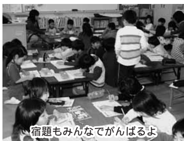
宿題もみんなでがんばるよ