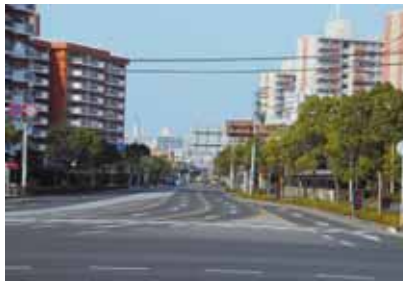
滑走路の名残をとどめる広々とした道路の両側には高層マンションが並ぶ

滑走路の海側は空き地になっていて、現在では考えられませんが、滑走路の先を横切り、そこに畑を作っている人たちがいました。鴨池空港から飛び立った飛行機は県体育館や八幡小学校の真上を通りました。当時、八幡小学校で教員をしていましたが、授業中、騒音やテレビ画面の乱れがひどくて大変だったのを覚えています。ちょうどテレビを教育に取り入れようとしていた時期だったので、影響が大きかったですね。 騒音や飛行機の大規模化などにより、空港が溝辺に移転したのが昭和47年。近くに