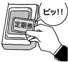
通勤、通学にご利用ください

■市電・市バス定期券のご活用を ◇定期券の新規・継続購入...有効期間開始日の14日前から購入可 ◇端数定期券...定期券に30日を超えない日数を追加できます ◇利用日限定定期券...月~金曜日に利用できます ◇市バス定期券は、券面に記載された路線外でも有効区間内であれば、乗降可能なバス停や電停もあります ◇乗車券発売所で乗降可能な停留所一覧をお渡ししています ◇詳しくは交通局257-2111へ