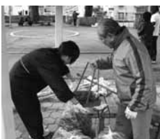
地域の清掃活動を支援

■まち美化推進団体の募集 ◇対象...月1回程度、公共の場所の清掃活動を実施する町内会や学校などの団体 ◇支援内容...清掃用具、啓発バスタの提供など ◇詳しくは環境衛生課216-1300へ