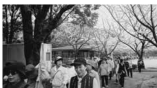
運動普及推進員と安全なウォーキングを楽しみましょう

※雨天のときは翌日に順延 ◇参加料...大人210円、中学生以下100円(入園料と保険料) ◇受け付け...平川動物公園正面入口前で9時30分~ ※弁当は各自持参 ◇詳しくは各保健センターへ