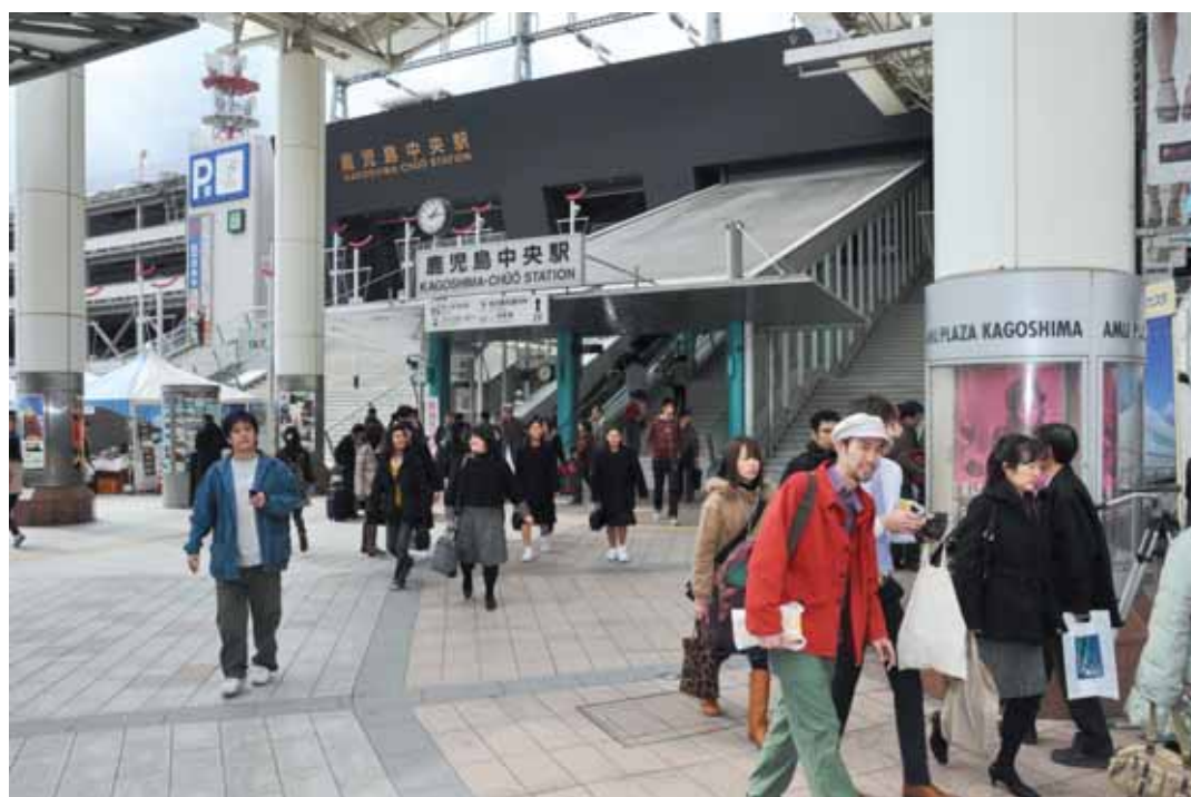
2月18日にリニューアルオープンした鹿児島中央駅