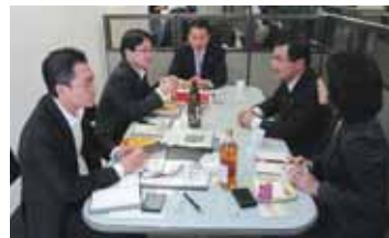
鹿児島の特産品の魅力を生かしてPR

■1月30日~2月2日 韓国での市長トップセールス(ソウル市) 歴史的に古くから交流のある韓国と鹿児島の一層の交流拡大のため、市長がソウル市を訪れ、定期便を運航している航空会社や旅行会社、大手百貨店などで本市の観光の魅力や特産物のPRを行いました。