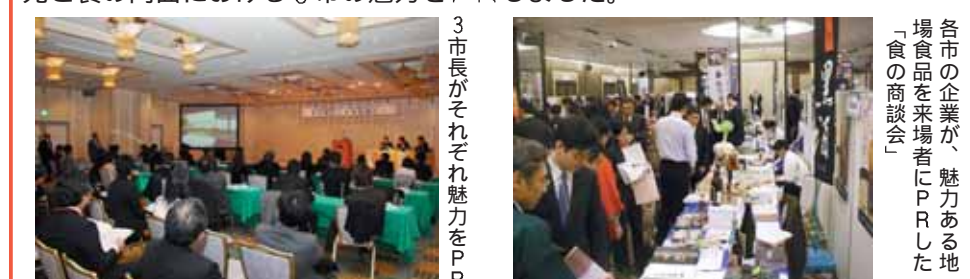
各市の企業が魅力ある地場産品をPRした「食の商談会」

■2月5日 鹿児島・熊本・福岡 三都市連携大阪プロモーション(大阪市) 関西圏の中心地・大阪市で行われた「鹿児島・熊本・福岡 三都市連携大阪プロモーション」。市長をはじめ、熊本市の幸山市長、福岡市の吉田市長が観光と食の両面における3市の魅力をPRしました。