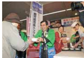
鹿児島島の食材を使った豚汁は大人気

■1月26日~31日 2010鹿児島島の物産と観光展(福岡市) 会場のデパートは、鹿児島島の自然の恵みや伝統文化が育んだ逸品を求める多くの買い手客でにぎわいました。 30日には市長がトップセールスを行い、来場者に鹿児島県産の黒豚と桜島大根を使った豚汁を振る舞うなど、鹿児島を大いにPRしました。