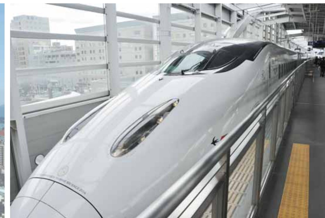
昨年8月から運転を開始した九州新幹線新800系

九州新幹線全線開業まであと1年。全線開業に伴い運行される「新幹線さくら」で新大阪まで約4時間でつながる“新幹線・大交流時代”が到来します。観光施設の整備やリニューアルを進め、新たな魅力を創造し、鹿児島の魅力を全国に発信するための本市の取り組みを紹介します。