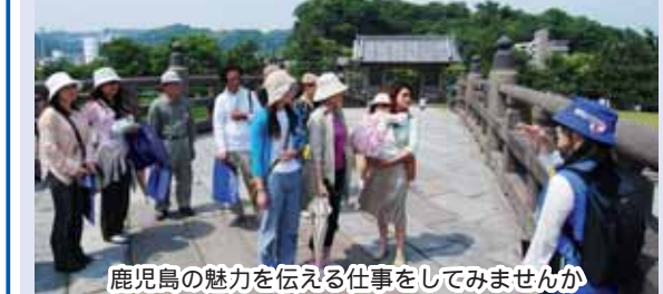
鹿児島島の魅力を伝える仕事をしてみませんか

「鹿児島島ぶらりまち歩き」でのガイド、市内の主要観光地での定点案内、大会・イベントなどで観光コーナーのサポートなどを行うボランティアガイドを募集します。 ◇対象 市内に住むが通勤・通学する20歳以上の人 ※平日も勤務できる人を優先します ◇定員 50人程度(4月末に選考会を行います) ◇申し込み 郵送かファックス、Eメールで住所、氏名、年齢、性別、職業、電話番号を、4月16日(必着)までに〒892-8677山下町11-1 観光企画課216-1344(FAX216-1320、Eメール kan-ki04@city.kagoshima.lg.jp)へ