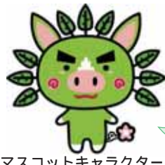
マスコットキャラクターのぐりぶー

県立吉野公園をメイン会場、鹿児島ふれあいスポーツランドをサブ会場とし、花と緑豊かな鹿児島の魅力を全国に発信します。