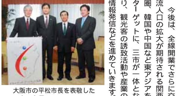
大阪市の平松市長を表敬した3市の市長