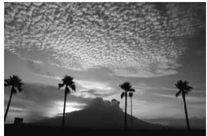
市景観写真コンテスト 最優秀賞作品 桜島の夜明け