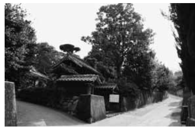
第2号 藤崎家武家門 (桜島藤野町854)