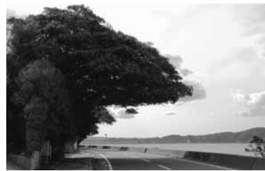
第4号 アコウ (桜島藤野町1223-1)