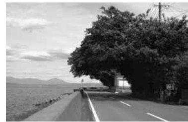
第5号 アコウ (桜島藤野町928)