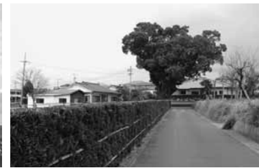
第3号 クスノキ (下福元町7683-3)