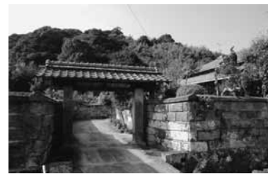
第3号 牧瀬家武家門と石塙 (喜入町7962)