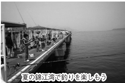
夏の錦江湾で釣りを楽しもう

◇大漁賞(釣った魚の全部の重量)と大物賞(1匹当たりの重量)の1位に賞品を贈呈 ◇対象…小・中学生(小学生は保護者同伴) ◇日時…7月18日(日)~25日(日)7時~15時 ◇定員…各日30人程度 ◇参加は無料(使用料は別途) ◇検量は15時で締め切り ◇申し込み…電話かファックスで鴨池海づり公園252-1021(ファックス同じ)へ