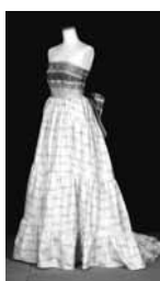
博多織とコラボした本場大島紬のドレス

③製造業アドバイザー派遣制度 ◇内容 経営の改善や新商品の開発、デザイン考案などについて指導・助言を行う製造業アドバイザーの派遣 ◇費用 無料 ◇派遣回数 1企業につき年3回まで(1回の時間は3時間以内)