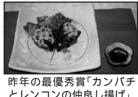
昨年の最優秀賞「カンパチとレンコンの仲良し揚げ」

旬の魚料理コンクール ◇題材となる魚 カンパチ、サバ、サンマ、キビナゴ、イカ ◇対象 県内に住む人 ◇申し込み 応募票を9月30日(必着)までに〒892-0835城南町37-2魚類市場223・0310へ ◇日時 9月16日(木)18時30分~21時 ◇場所 谷山北公民館 ◇定員 24人(超えたら抽選) ◇参加料 無料 ◇申し込み 往復はがき(1人1通)に住所、氏名、年齢、電話番号を書いて9月2日(必着)までに〒892-0835城南町37-2魚類市場223・0310へ ※魚食普及協議会ホームページからも申し込み可