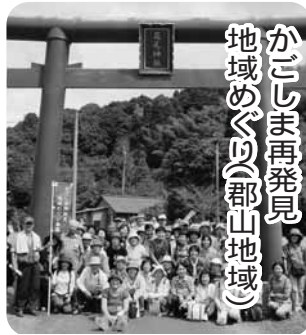
かごしま再発見 地域(郡山地域)

◇内容 花尾神社、甲突池などの郡山地域の多彩な地域資源を見学 ◇対象 市内に住む人 ◇日時 9月18日(土)9時~16時30分 ◇集合場所・時間 みなと大通り公園・8時45分、鹿児島中央駅西口・9時、伊敷脇田バス停・9時15分 ◇定員 100人(超えたら抽選) ◇昼食 各自持参 ◇参加料 1人3000円 ◇申し込み はがき、ファックス、Eメール(いずれも複数人記入可)で住所、参加者全員の氏名(ふりがな)、年齢、性別、電話番号、希望集合場所を8月31日(消印有効)まで