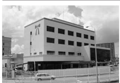
整備が進む「すこやか子育て交流館」