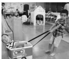
【親子つどいの広場 226-5539】

◇子育て中の親とその子どもが、いつでも気軽に集い、交流できます ◇保育士が常駐し、子育ての相談や援助、情報提供などを行います ◇住所 中町4-13 ◇開館時間 10時～18時(12月29日～1月3日は休館)