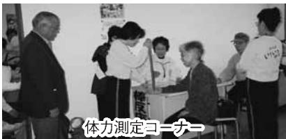
体力測定コーナー

①北部ふれあい健康まつり ◇日時…11月8日(月)10時~15時 ◇場所…北部保健センター ◇詳しくは北部保健センターへ ②第22回東部健康づくり交流会 ◇日時…11月5日(金)10時~15時30分 ◇場所…中央公民館 ◇詳しくは東部保健センターへ ー共通事項ー ◇内容…体験発表、脳活性化や食生活コーナー、体脂肪・体力測定、ちびっこ体操など ◇入場は無料