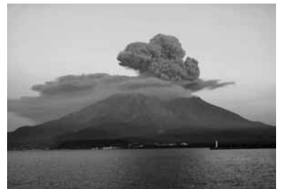
平成22年度掲載作品 「桜島暮色」

来年4月1日発行の市民フォト鹿児島No.120「あなたのフォトサロン」に掲載する、あなたのベストショットを募集します。 ◇作品テーマ ①人物部門「ガンバルかごしま人」(趣味や働く表情、祭りやイベントに参加するなど輝いている人) ②風景部門「美しい鹿児島の姿」(未来に残したい市内の景観や文化、芸術など) ◇募集期限 来年1月31日(消印有効) ◇応募規定 ①今年2月1日~来年1月31日までに市内で撮影された未発表の作品 ②応募は1人2点まで。どなたでも応募可 ※出品料は無料 ③四つ切かワイド四つ切のカラー写真応募作品は返却しません ④加工・合成した写真は応募不可 ⑤被写体の肖像権は承諾済のもの ⑥掲載作品の著作権と使用权は本市に帰属し、本市が行う写真展で使用することがあります ⑦作品の裏面に、作品ごとに必要事項を記載した応募票を貼り付けてください ※応募票は市ホームページからダウンロードできます ◇賞 特選2点、入選4点 ◇作品審査 来年2月下旬ごろを予定(結果は来年3月上旬に市ホームページで発表。特選者と入選者には直接通知します) ◇申し込み 直接か郵送で〒892-8677 山下町11-1広報課「あなたのフォトサロン」係 216-1133へ