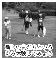
新しい友だちといっしょに体験してみよう

◇内容…正月飾り作りやニュースポーツ、歴史見学、自然とのふれあい体験など ◇対象…小学4年～6年生 ◇日時…12月27日(月)10時～28日(火)15時(1泊2日) ◇場所…スパランド裸・楽・良 ◇定員…30人(超えたら抽選) ◇参加料…5800円 ◇申し込み…はがきに住所、氏名、電話番号、学校、保護者名を書いて、12月20日(必着)までに〒891-1102東俣町1450スパランド裸・楽・良245-7070へ