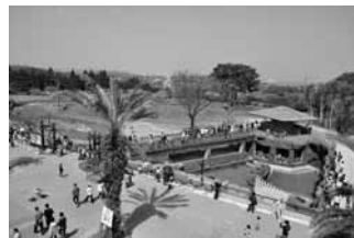
平川動物公園 アフリカの草原ゾーン