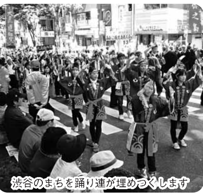
渋谷のまちを踊り連が埋めつくします