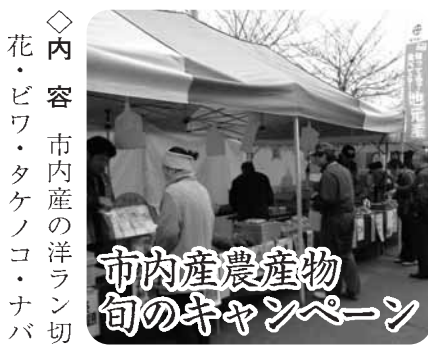
市内産農産物旬のキャンペーン