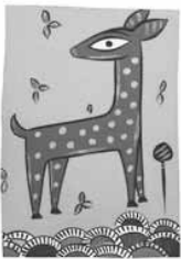
ジャミニ・ロイ 「小鹿」

■三都市連携特別展「アジア美術の近・現代」 三都市交流連携事業の一環として、福岡アジア美術館の所蔵品を展示。普段接する機会の少ない中国・韓国・東南アジアなどの作家の作品27点を通して、アジアの国々の民族的、宗教的な造形物や都市の大衆芸術など、アジアの豊かな視覚表現を紹介します。 ◇期間 3月18日(金)～4月17日(日) ◇開館時間 9時30分～18時 (入館は17時30分まで) ◇休館日 月曜日(祝日のときは翌平日) ◇観覧料 一般200円、高校・大学生150円、小・中学生100円(3月31日まで。4月1日からはそれぞれ300円、200円、150円)