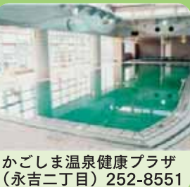
かごしま温泉健康プラザ(永吉二丁目) 252-8551