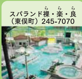
スパランド(東俣町) 245-7070