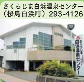
さくらじま白浜温泉センター(桜島白浜町) 293-4126