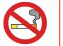
登録されると認定証とステッカーを配布