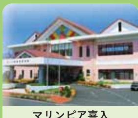
マリンピア喜入(喜入町) 345-1117