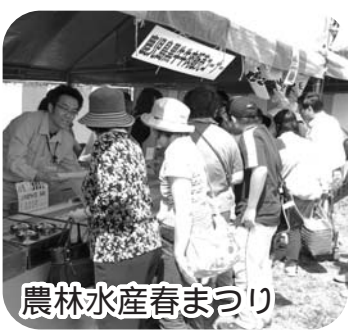
農林水産春まつり