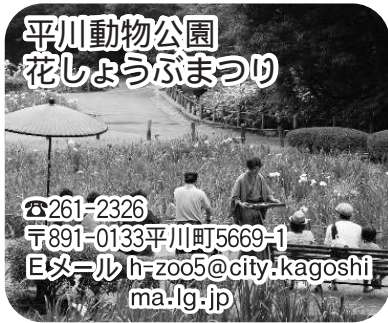
平川動物公園 花しょうぶまつり

☎261-2326 〒891-0133平川町5669-1 Eメール h-zoo5@city.kagoshima.lg.jp