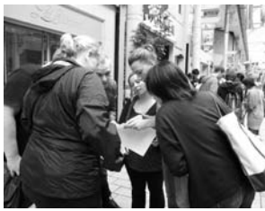
みんなで力を合わせてゲームに挑戦

◇申し込み 電話かファクス、Eメールで住所、氏名、年齢、電話番号を5月27日(必着)までに市国際交流市民の会(国際交流課内)216-1131(FAX239-9258、Eメール kokusai3@city.kagoshima.lg.jp)へ