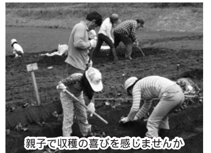
親子で収穫の喜びを感じませんか

内 サツマイモの苗植えから収穫までの体験 対 苗植えや除草、収穫のすべてに参加できる幼児～中学生とその家族 期 5月21日(土)か29日(日)10時～12時 所 市立少年自然の家 定 各30組(超えたら抽選) 料 200円程度(肥料代)と傷害保険料20円(任意) 申 電話かはがき、ファクスで希望日、住所、参加者全員の氏名(ふりがな)、学校名、学年、電話番号を5月13日(必着)までに〒892-0871吉野町11078-4市立少年自然の家244-0333(FAX244-0334)へ