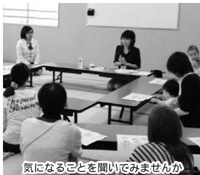
気になることを聞いてみませんか

対 未就学児とその親 期 5月27日(金)10時30分～11時30分(受け付けは10時から) 所 慈眼寺公園 ①② 共 料 無料 申 不要 問 親子つどいの広場226-5539