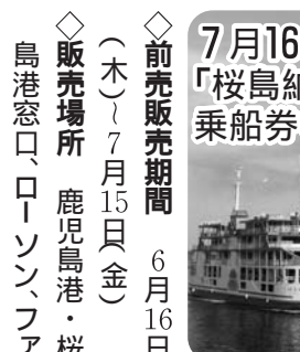
7月16日運航開始 「桜島納涼観光船」乗船券の前売販売

◇前売販売期間 6月16日(木)~7月15日(金) ◇販売場所 鹿児島港・桜島港窓口、ローソン、ファミリーマート、サンクスなど ◇運航期間 7月16日(土)~8月31日(水) ※8月13日(土)~15日(月)は運休 ◇前売料金 大人(中学生以上)900円(当日券1000円)、小児450円(当日券500円) ※各種割引、ファミリー乗船券もあります 船券部営業課 293-252