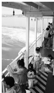
2011 鹿児島カップ 火山めぐりヨットレース

受け付け後、抽選 ・平日分(予約のない土・日曜日、祝日を含む) 6月26日13時(電話は13時30分)~17時、翌日以降は毎日8時30分~17時に順次受け付け 【錦江湾公園キャンプ場 261-9833、公園緑化課 216-1366】