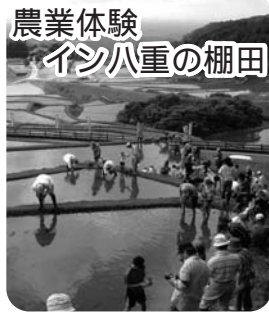
農業体験 イソ八重の棚田

◇集合場所 八重棚田館 雨具・タオル・着替えを持参してください ◇申し込み 電話かファクスで住所、氏名、学年、電話番号を郡山農林事務所 298-4861(FAX298-2835)へ