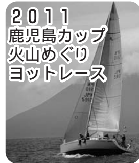
2011 鹿児島カップ 火山めぐりヨットレース

◇常設テント使用料(1泊1張) 500円(40張) 12人用 1200円(5張) ◇申し込み 土・日曜日、祝日分 6月26日9時~9時30分に直接、公園管理事務所へ