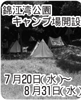
錦江湾公園 キャンプ場開設 7月20日(水)~8月31日(水)

◇集合場所 八重棚田館 雨具・タオル・着替えを持参してください ◇申し込み 電話かファクスで住所、氏名、学年、電話番号を郡山農林事務所 298-4861(FAX298-2835)へ