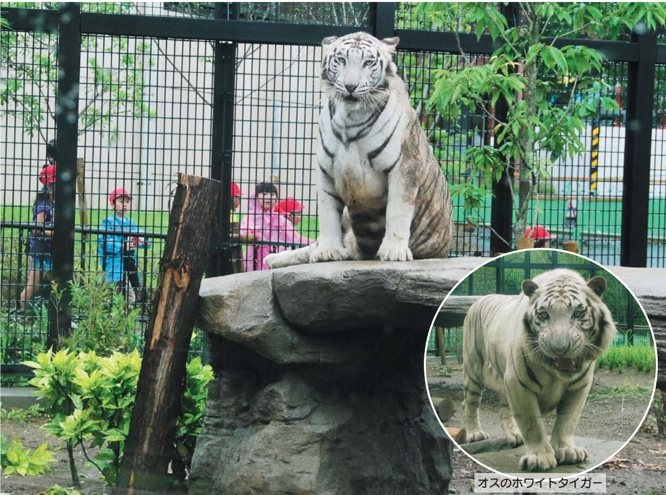
オスのホワイトタイガー