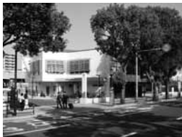
観光交流センター

◇見学先 国際交流サロン、かごしま県民交流センター、鹿児島アリーナ、観光交流センター、維新ふるさと館、交通局 ◇対象 市内に住む人 ◇日時 9月6日(火)9時～15時 ※みなと大通り別館に8時45分集合 ◇定員 45人(超えたら抽選) ◇参加料 300円 ◇昼食は持参 ◇申し込み はがきかファクス、Eメールでコース名、住所、参加者全員の氏名(5人まで)、年齢、電話・ファクス番号を〒892-0847西千石町1-24(株)霧島観光社226-3388(FAX 226-7623、Eメール kirikan@po.minc.ne.jp)へ ※県知事登録旅行業第2-30号 【広報課 216-1133】