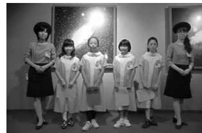
制服を着て、科学館の仕事を体験しよう

対小学4年～6年生の女子 期9月11日(日)9時～15時 定4人(超えたら選考) 料無料 申市立科学館にある申込用紙かはがきに住所、氏名、学年、学校名、電話番号、応募の理由を書いて、8月31日(必着)までに〒890-0063鴨池二丁目31-18市立科学館「1日コンパニオン」係250-8511へ