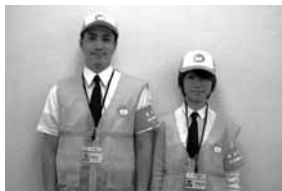
安心安全火の用心サポーター

◇消防職員や安心安全火の用心サポーターは、住宅用火災警報器の販売やあっせん、電話での調査は行っていません。不審に思ったらまず連絡を 問 消防局