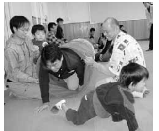
パパと一緒に遊ぼう

対①は妊娠中の人か離乳食を始めた子どもとその親、②は5歳～小学3年生の子どもとその親、③は2歳⑤は4歳以上の未就学児とその親、④は小学3年生までの孫をもつ祖父母、⑥は2歳までの子どもとその親 ◇定員を超えたら抽選(当選者に受講証を送付) 料無料(①②④⑤は材料費など実費負担) ◇申込期限 9月12日(消印有効)