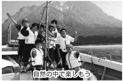
自然の中で楽しもう

内野外炊飯活動、露天風呂、クルージングなどの自然体験 対市内に住む小・中学生とその家族 期10月15日(土)～16日(日)1泊2日) ※事前説明会あり 所冒険ランドいおうじま(三島村) 定12家族(超えたら抽選) 料大人7000円、子ども3500円(団体割引あり。食材費などは実費負担) 申はがきに住所、参加者全員の氏名、学校名、学年、電話番号を書いて、9月22日(必着)までに〒892-0816山下町6-1 青少年課227-1971へ