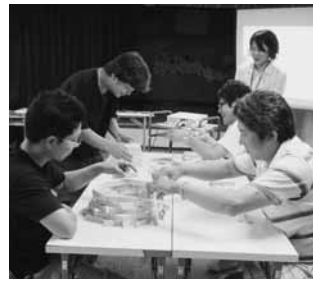
積み木やビデオを通じて自分を取り巻く環境を知ろう

申 はがきかファクスで講座名、住所、氏名、年齢、電話番号を11月15日(必着)までに〒890-0062と次郎一丁目10-17すこやか子育て交流館812-7740(FAX)812-7744)へ