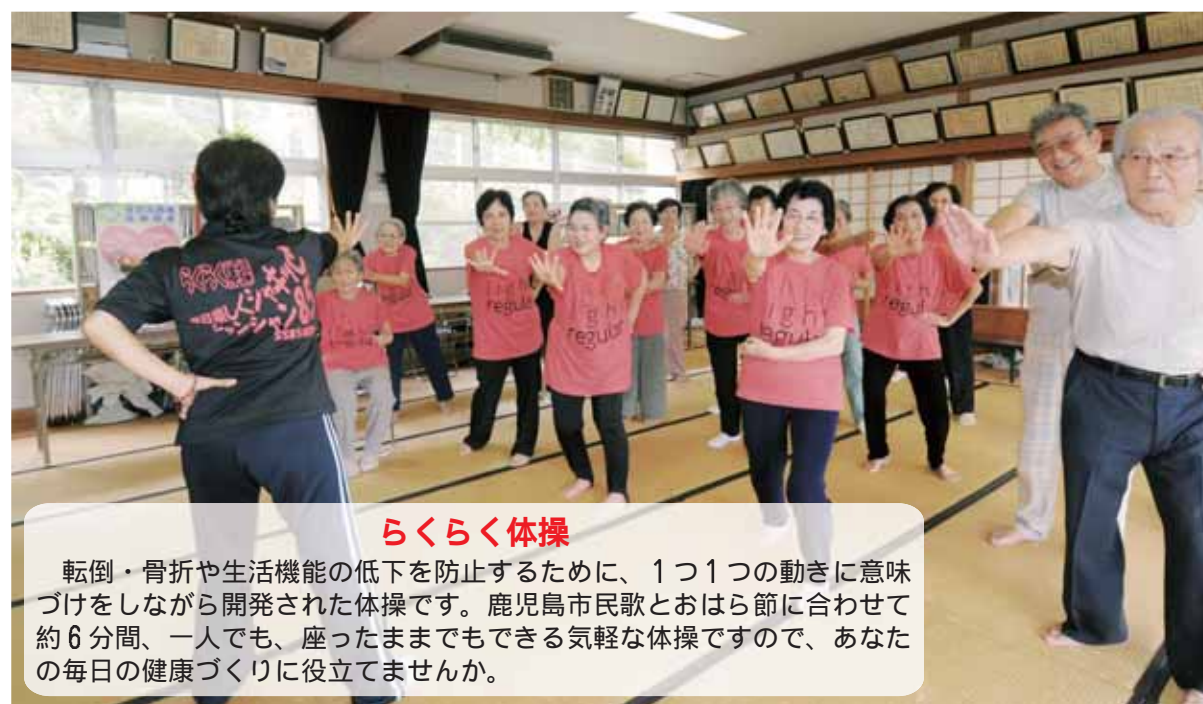
らくらく体操 転倒・骨折や生活機能の低下を防止するために、1つ1つの動きに意味づけをしながら開発された体操です。

がんの種類によって違いはありますが、発見が早いほど生存率や治療にかかる費用にも違いがあると言われています。 がんの早期発見のために、年1回の検診を受けることが大切です。