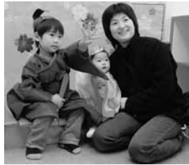
おひなさまとおだいり さまに変身