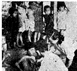
(写真は保育所における診察)

福祉事務所の母子係では、猫の供のしつけと御守りを受けました手でも借りたい農村の農婦に子供を預かるのであります。