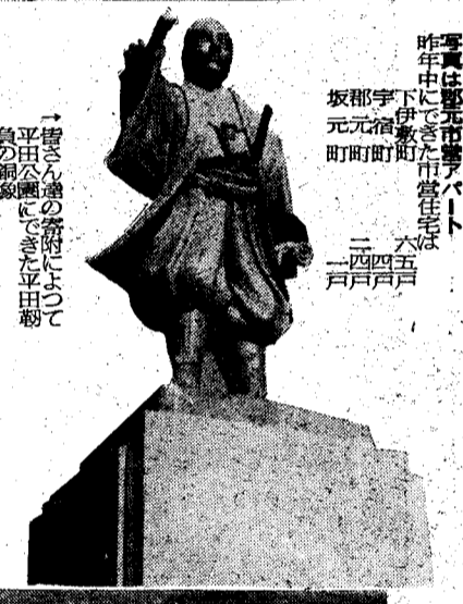
→橋さん達の奮闘によつて 平田公園にできた平田 橋の銅像