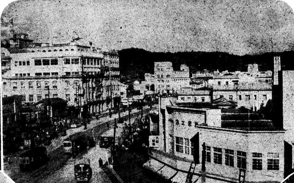
幹線道路もしだいに整備されてきました。たゞ今は市役所前通りの 舗装工事を行っています。写真は舗装なつたいづろ通り附近