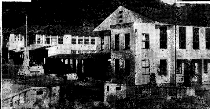
写真は新しくできた玉置高校体育館 学校 昭 31 校舎の新設第 1 2