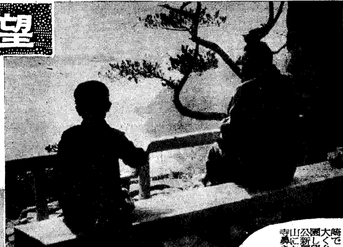
寺山公園大崎 鼻に新しく きた展望台

新年おめでとうございます。鹿児島市の都市計画も現在順調に進んでおります。昨年中いろいろの施設をしましたが、そのうち主なる写真をここに拾ってみました。今年はより以上に立派な鹿児島市になるよう努力したいと思っております。