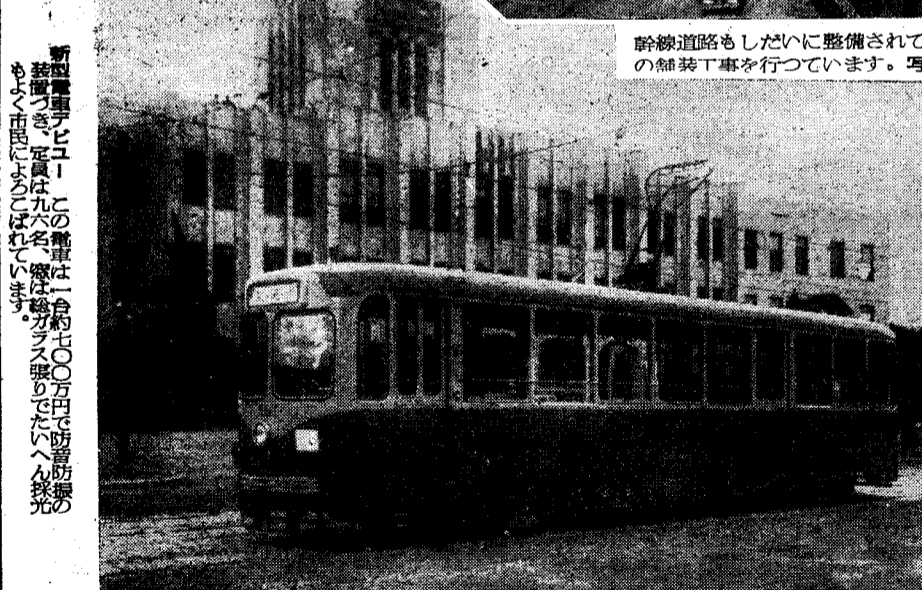
新製電車「ビュイ」この電車は一台約七〇〇万円を防音防振の 装置つき、定員は九六名、窓は強化ガラス張りだといへん採光 もよく市民に喜ばれています。