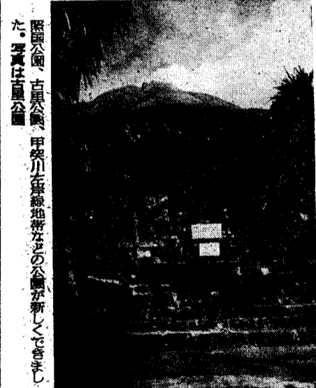
照園公園、古里公園、甲斐川沿岸緑地帯などの公園が新しくできまし た。写真は古里公園