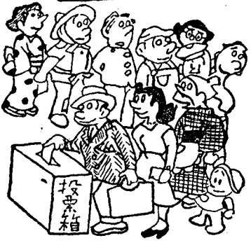
投票時間 午後7時より

す。即ち中正な態度で國政の運営を監視し衆議院の行きすきを是正し、中正な意見を政治に注入しようがためであります。その指し示るるの点を考へてみましても参議院の権限は衆議院に比し少しも劣るものではないといつてかまわないのであります。 参議院議員選挙は、このような重要な参議院を構成する人々を選挙する選挙なのであります。日本の参議院議員は定員二五〇名で、 (一) 全国区から選出される一〇〇名 (二) 都道府県の地方区選出一五〇名 から構成され、三年毎に半数を改選するしくみになっておられます。國の政治をよくするため、悪くするの、国会であります。国会をよくするため、悪くするの、その議員であります。その良の議員を出すの、悪い議員を出すのこの選挙の投票をする一人一人の国民なのです。 つまり、すべて国民がその選挙の一環にかかっているのです。