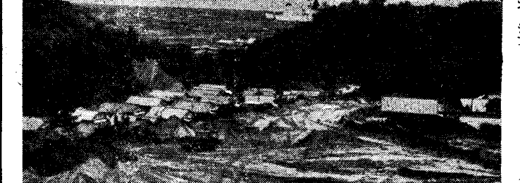
【写真は紫原住宅団地】

道路開発に新威力 新しいブルドーザーがまわりました。紫原台地の建設が約五〇〇万円で購入した三菱B4型ブルドーザーで、市内の道路開発や、紫原、南港などの整地作業に活躍することになります。