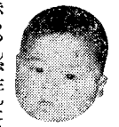
赤ちゃんが生れたとき

市役所では年末年始のしごとをつぎのとおりいたします。 ご用納め 二十七日(土) ご用始め 一月五日(月) なれ衛生課の葬儀関係だけは、一日だけ休み、あとは平常通り業務を行います。