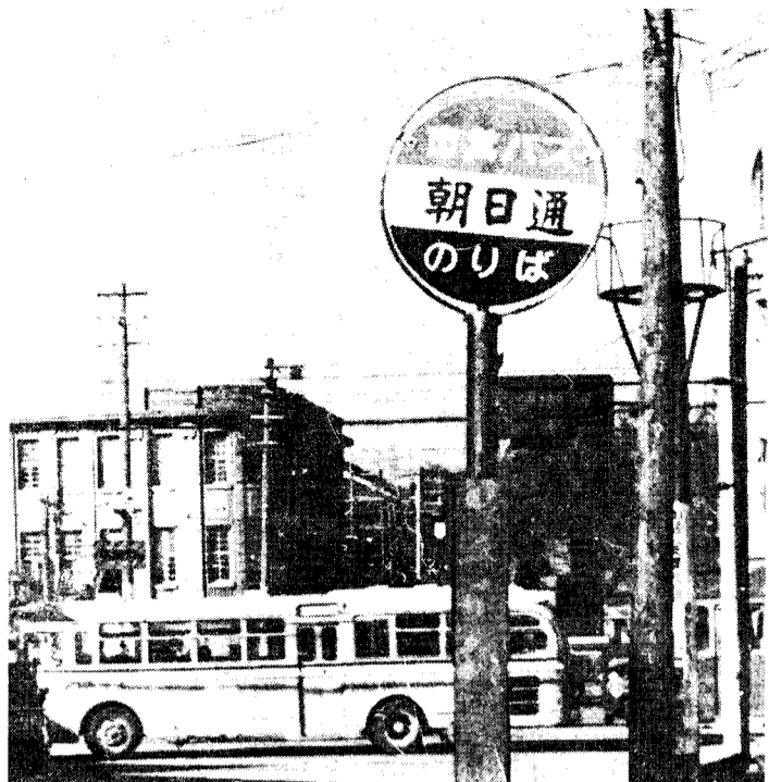
路線表及び始発・終発時間