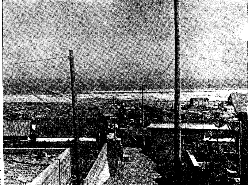
(旧鹿児島・谷山両市の市境附近)

新市発足後初めての市長選挙がこの五月二十一日(日)に行なわれます。 南九州の中核都市として躍進への一歩を踏み出した鹿児島市にとって、最も大切な時期といえる今後の四年間、私たちに代って市政を担当してもらう人を選ぶ、非常に大事な、そして身近な選挙です。 より明るくより豊かな、そしてより住みよい鹿児島市を築くために、与えられた権利を正しく使って、一人もれなく投票しましょう。 投票は午後六時までに 投票時間は、午前七時から午後六時までとなっています。ただし、黒神町・高免町・中山町の松林、柳ヶ谷地区・平川町の火の河原地区の四つの投票所は午後五時までです。ので、時間に遅れないようご注意ください。 投票所をまちがえないように選挙のときと同じ投票所です。ただし、第2投票区(照園)は、午前八時三十分から午後五時まで、市役所別館四階の選挙管理委員会事務局(谷山地区は谷山支所)で投票できます。また、指定された病院に入院中の人や指定された船舶に乗っている人は、その病院や船舶で投票できます。 代理投票 からだの自由な人や字を書けない人は、投票日当日投票所にいる投票管理者に申し出れば、係員が代って書いてくれます。ただし、投票所まで必ず本人が行かなければなりません。 点字投票 目のみえない人は、投票管理者に申し出て、点字により投票することができます。