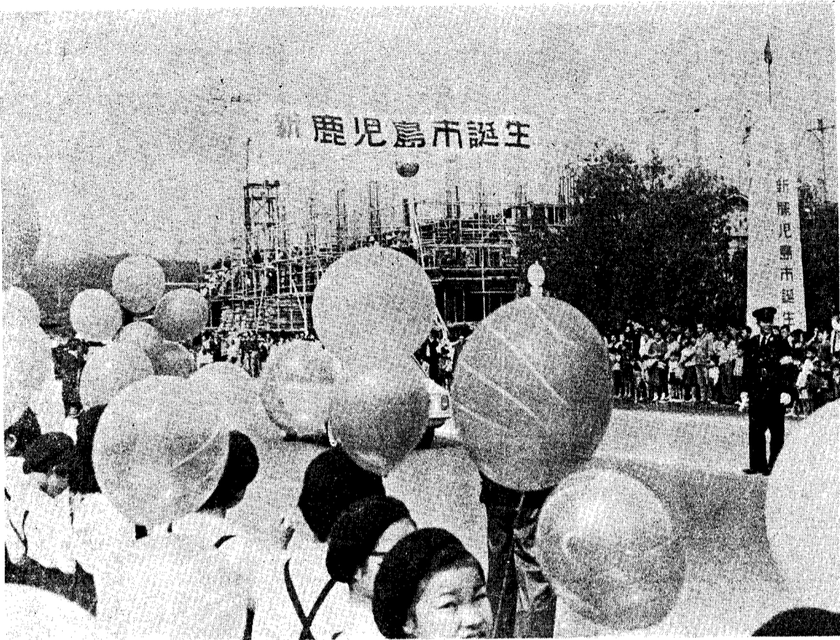
(4月29日地区民も参加して市境で行なわれた合併式風景)

四月二十九日、二十年來の懸案であった鹿児島・谷山両市の合併が実現し、面積二百七十九・一五平方キロメートル、人口約三十八万四千人の大鹿児島市が誕生しました。新市発足のこの日、国道二二五号線上の市境では両市の合併式が行なわれ、鴨池・谷山両小学校の鼓笛隊の行進のあと、市境に張られた純白のテープに旧鹿児島・谷山両前市長の手でハサミが入られ、市境が取り除かれました。名実ともに両市は一つになり、南九州の中核都市として、さらに大きく飛躍するための一歩を踏み出したのです。みんな力で合わせ、より明るくより豊かなそしてより住みよい町に育てあげましょう。