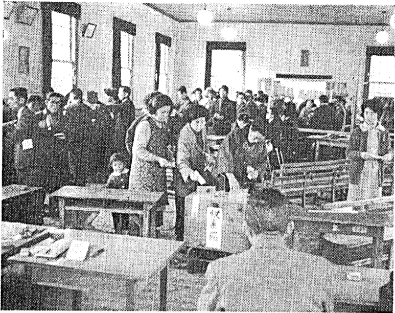
(あなたの一票が、市政をささえます)

一人もれなく投票を 選挙には、次のような投票の方法もあります。これらの方法を使って一人もれなく投票しましょう。 ◇不在者投票 印鑑と案内状を忘れずに、投票日の当日、自分の投票区の区域外で職務または業務に従事しなければならぬ人とか、旅行、入院などが予定されていて、どうしても指定された投票所へ当日行けない人は、選挙期間中(四月十三日から二十二日まで、いずれも午前八時三十分から午後五時まで)は、市役所新館四階選挙管理委員会投票できま