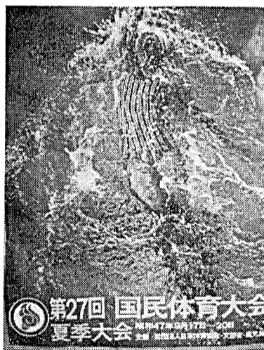
(あと2か月余りにせまった夏季国体)

申し込みは、①夏季大会の開会式と②秋季大会開会式、閉会式、第一次、第二次模擬国体の二種類にわけて受け付けますので、別図の記載例にしたがって、官製の往復はがきに記入していただき、このページの左下すみの入場券申し込みシールを切りぬき夏季大会、秋季大会それぞれ別々に(はがきを別にして)はってお送りください。シールのはってないものは無効とします。