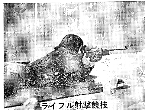
ライフル射撃競技

夏季大会まで 78日 (47.9.17~20) 秋季大会まで 113日 (47.10.22~27)