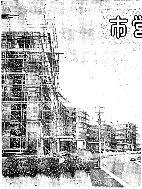
武岡団地に建設中の市営住宅