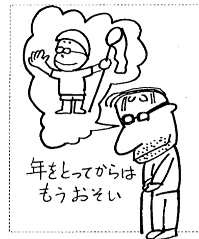
年をとってからはもうおそい

間を多くもちましよう。そのため にも、おうちの皆さんとできるだ けいっしょに 仕事をしたり お手伝いをし たりしましよ う。