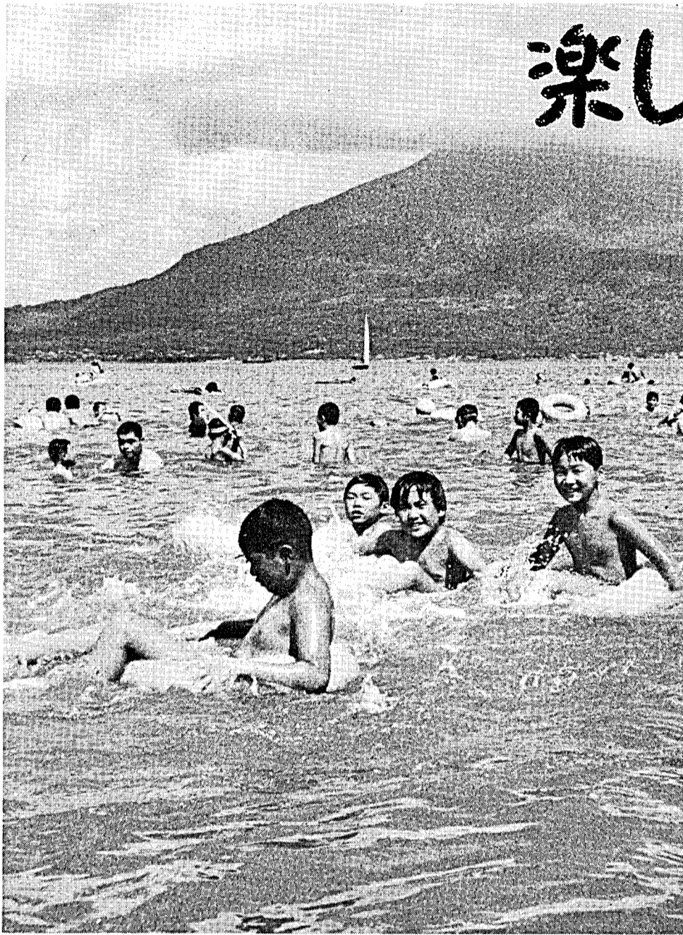
毎日子どもたちでにぎわう磯海水浴場

夏休みもやがてなかばになるうとしていますが、みなさんお元気でしょうか。宿題など計画的に進んでいますか。今月はこどもたちの夏休みのために、ここに「市民のひろば」こども特集号をつくりました。鹿児島市のことや、夏休み後半の過しかた、みんなの作品など集めてみましたので、みなさんの学習の参考にしてください。