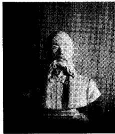
(美術館所蔵の胸像)

大久保銅像は、今どこにもない。わがくに、最近県が入手した北村西望作のブロンズ胸像と大熊氏が明治27年に制作した石ころ胸像が市立美術館と東京の国立博物館とに、それぞれ一体ずつあるだけで、