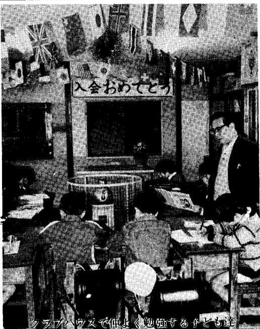
クラブハウスで仲間と勉強する子ども達

年ごとに人口の流入が激しく、過密化がすすむにつれてつぎつぎとビルや住宅が建ち並び、かつて子どもたちの楽しい遊び場所となっていた空地や田んぼもなくなり、車の増加に伴って道路も危険がいっぱいとなってきました。 また、共働きの家庭が多くなっており、子どもはカギ一本渡されておられるだけで、学校から帰ってきて誰もいない家の中でヒソソリと勉強していたり、危険な場所を遊んでいる風景をみかけます。 このため、市でもこれらのカギっ子達を下校時から、夕方保護者が帰宅するまでの間健全な育成をはかるためのクラブの結成を各地域に呼びかけていたところですが、その第一号として去る二月十三日草牟田地区に「草牟田児童育成クラブ」が発足しました。 クラブハウスはプレハブ造り三十七平方メートルのささやかな建物ですが、子ども達にとっては安心して遊べる何よりの贈り物でしょう。