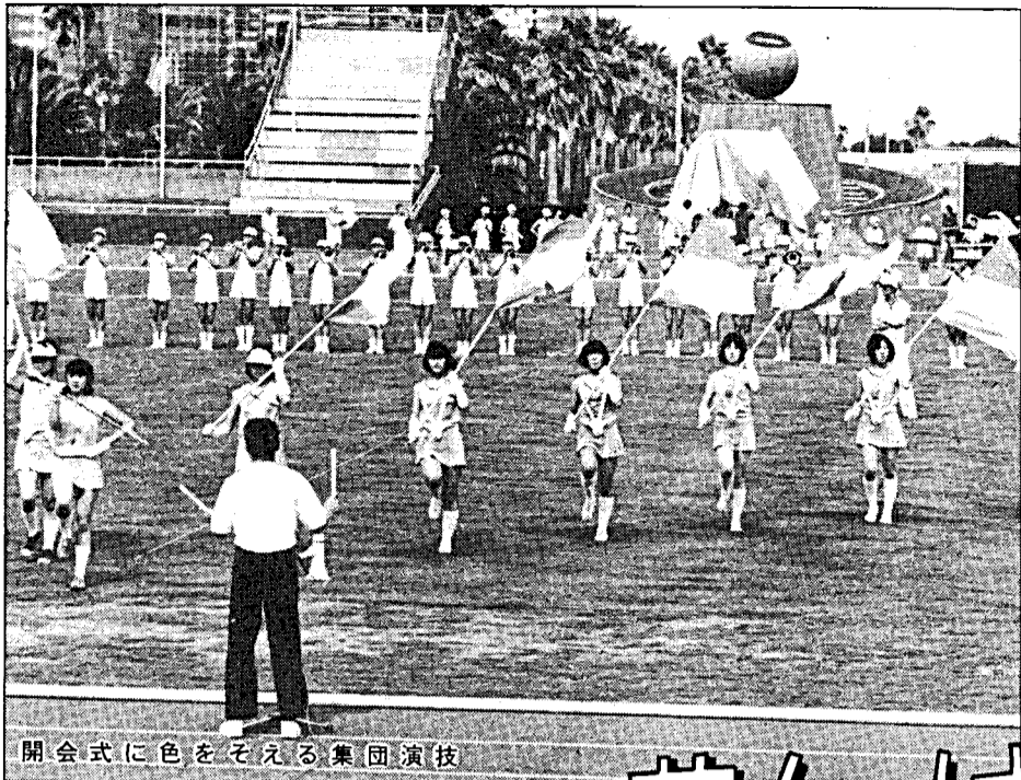
開会式に色をそえる集団演技

太陽国体以来、久々に行われる大規模な催し高校総体。全国から三万人余りの若人が集い、二十五の種目に技を競います。市内では、七種目の競技が行われますが、この大会を円滑に運営するため、関係団体と密接な連携を図りながら大会準備を進めています。また、競技会場や練習会場の確保、リハールの実施、競技役員、競技補助員の編成、委嘱などの作業を既に終え、今、本番に向けて最後の点検が進められています。